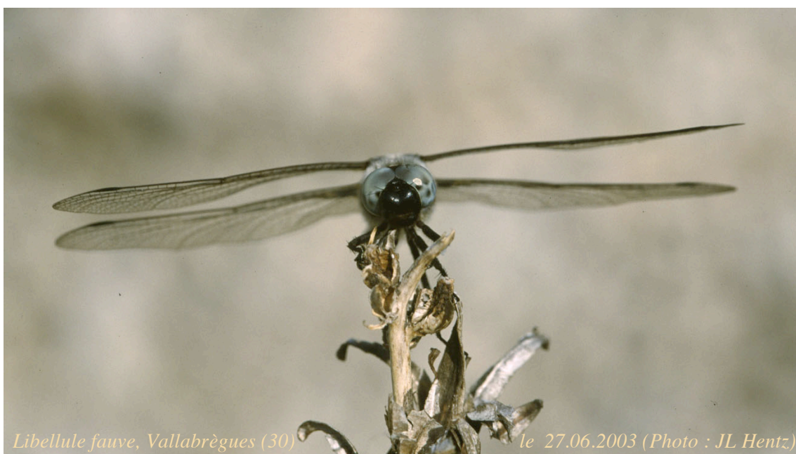
Libellule fauve, Vallabrègues (30)